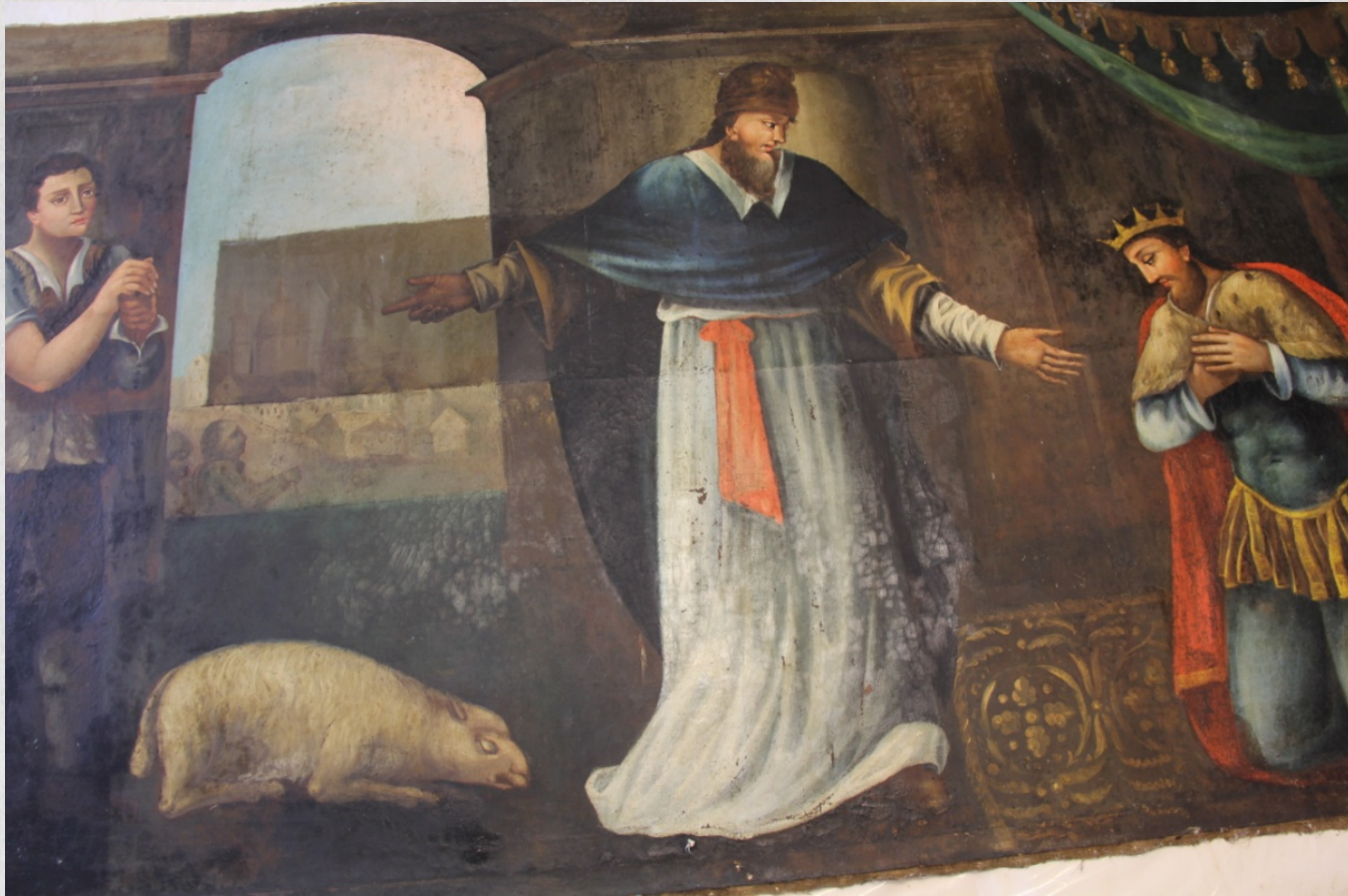
L'incontro tra Re David e il Profeta Nathan

Rimozione polveri grasse, vernici ossidate, schizzi di calce