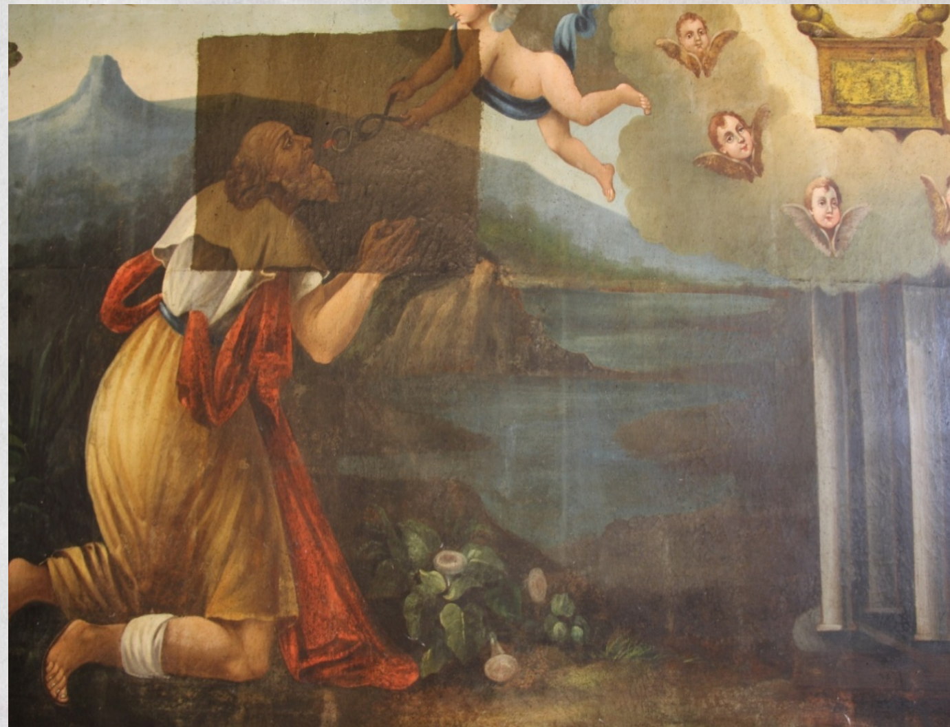
La visione del Profeta Isaia