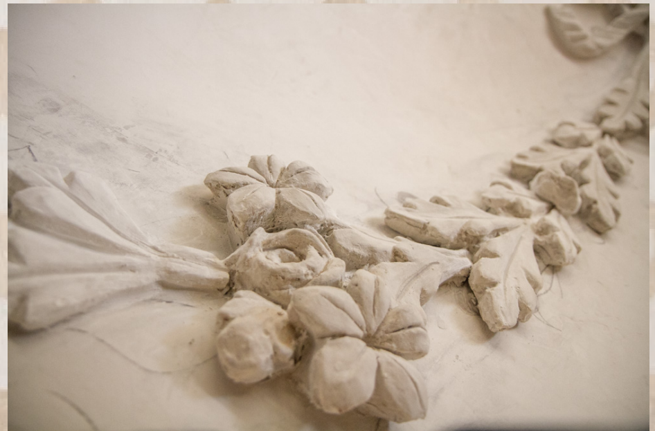
Particolare della ricostruzione degli stucchi originali