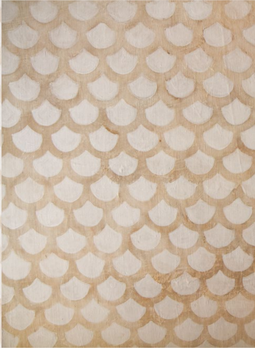
Particolare della decorazione originaria a scaglie sulla facciata principale